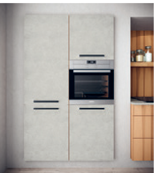
Camouflage: Der Einbau-Hochschrank mit den Fronten in Beton Grey nimmt sich vornehm zurück