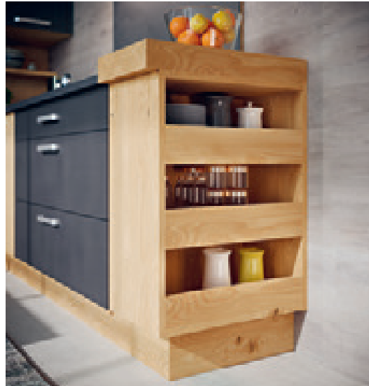
Schnellzugriff für ganz Eilige: Praktische Regalfächer an der Kopfseite der Küchenzeile

Die Lebendigkeit der Edelkastanie macht sich besonders gut, wenn sie auf die Coolness von Fronten in Beton Anthrazit trifft